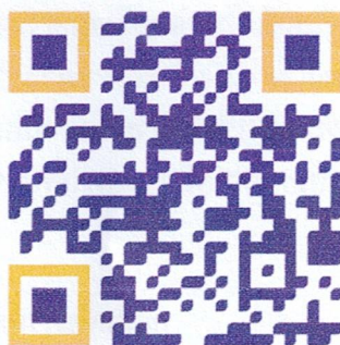
รับสมัครครูอัตราจ้าง

๑. กำหนดการและวิธีการรับสมัคร รับสมัครตั้งแต่วันที่ ๒ เดือนเมษายน พ.ศ. ๒๕๖๙ ถึงวันที่ ๒๖ เดือนเมษายน พ.ศ. ๒๕๖๙ โดยสมัครด้วยระบบออนไลน์ ตาม QR code ด้านล่างนี้